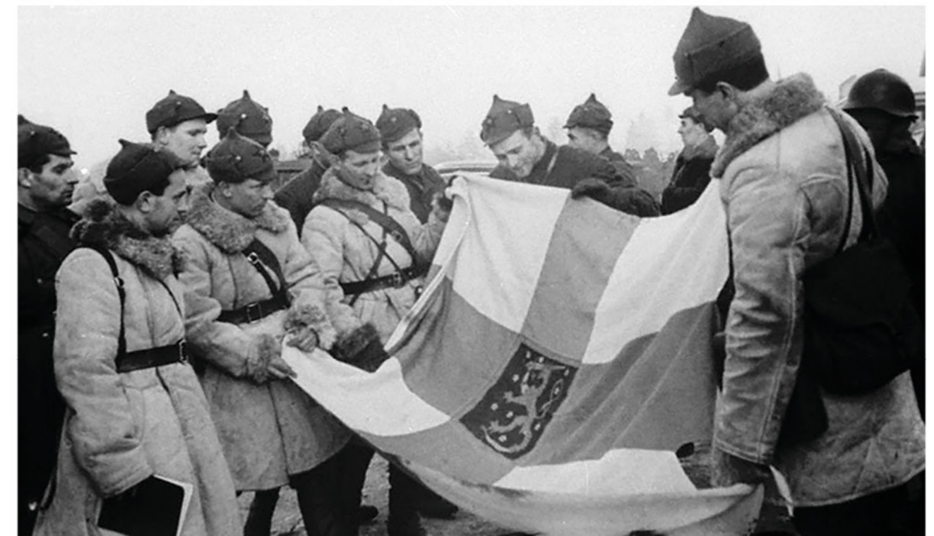
▶ Группа советских командиров и бойцов осматривает отбитое у финнов знамя Шюцкора. 1939 г.