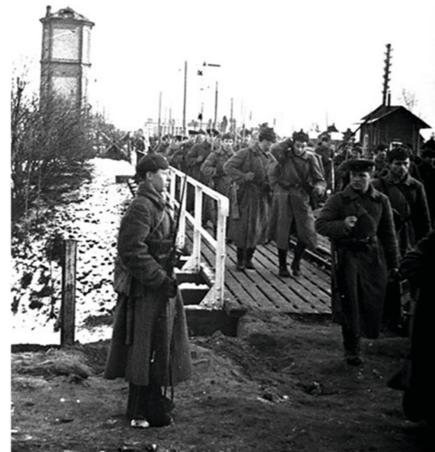
▶ Части Красной армии переходят по мосту на территорию Финляндии. 1939 г.

нительных сооружений длиной 132–135 км между Финским заливом и Ладогой, который был создан еще в 1920–30-х годах для сдерживания возможного наступательного удара со стороны СССР. Позже в огромном количестве документов можно