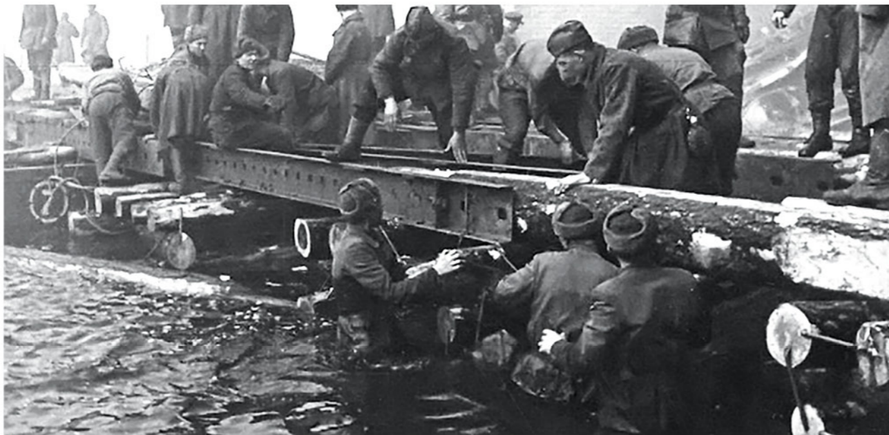
► Это уникальное фото прекрасно иллюстрирует военные будни понтонно-мостового батальона.