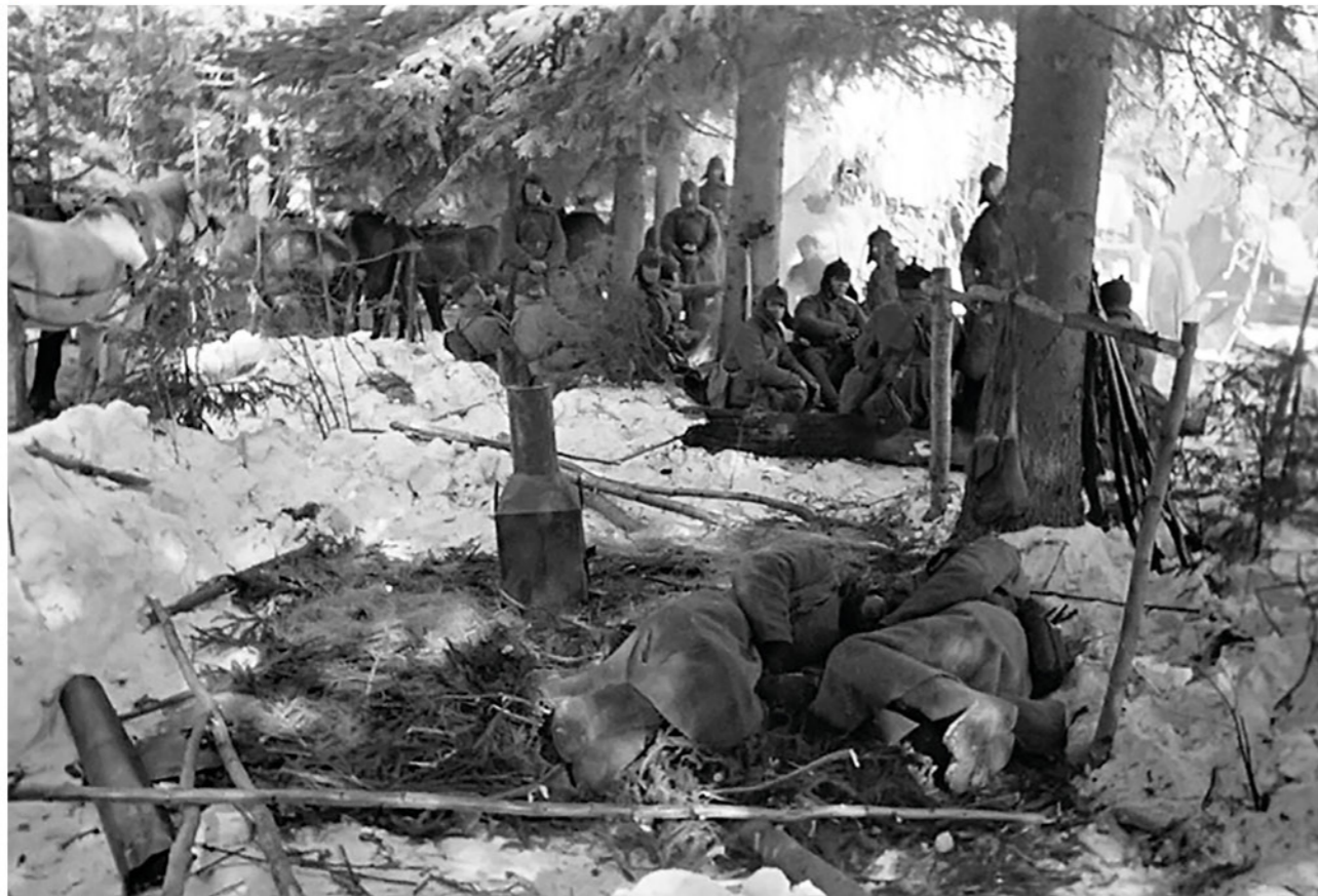
▶ Отдых красноармейцев после боя в районе деревни Кемья. 1940 г.