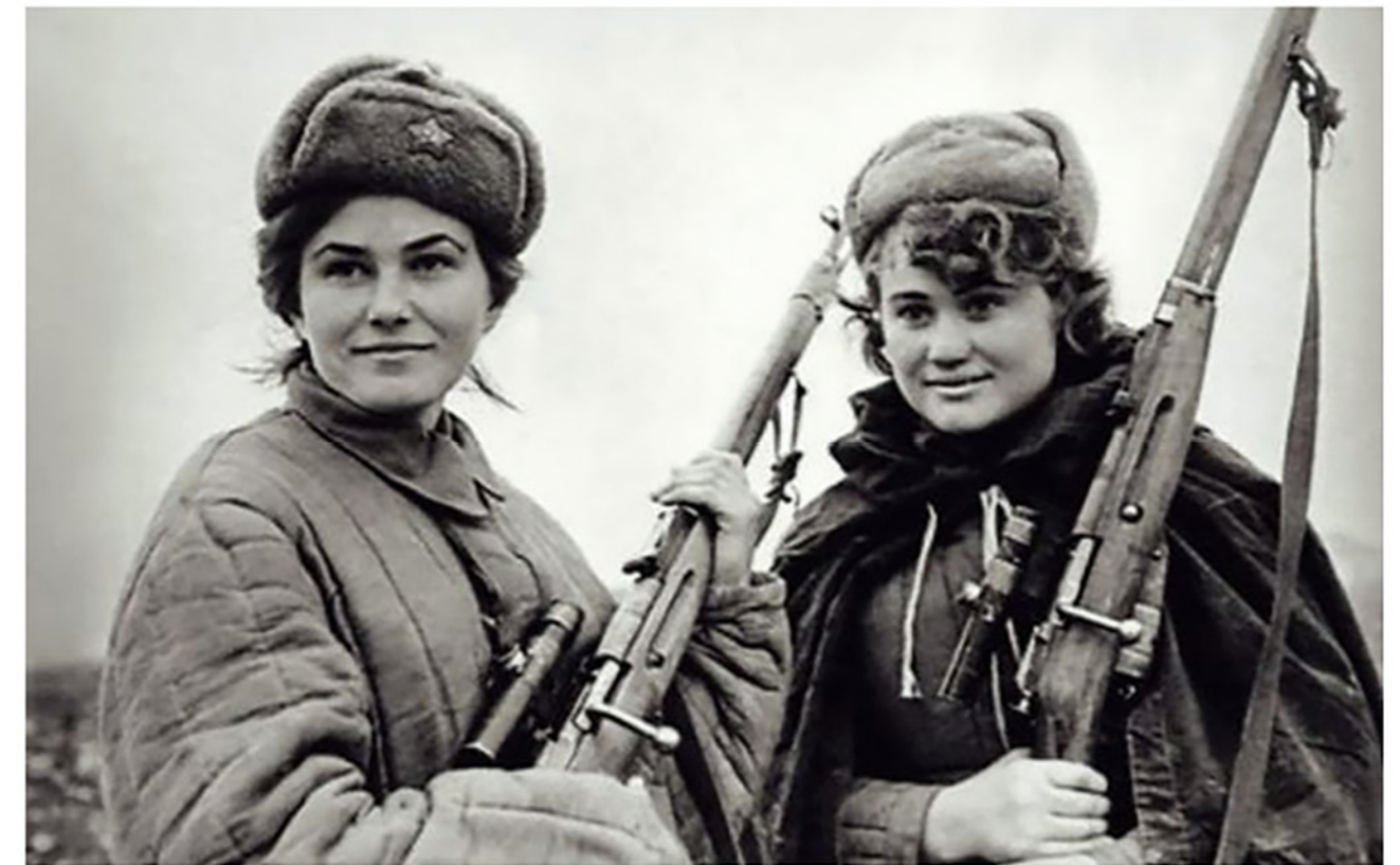
Женщины в партизанских отрядах.