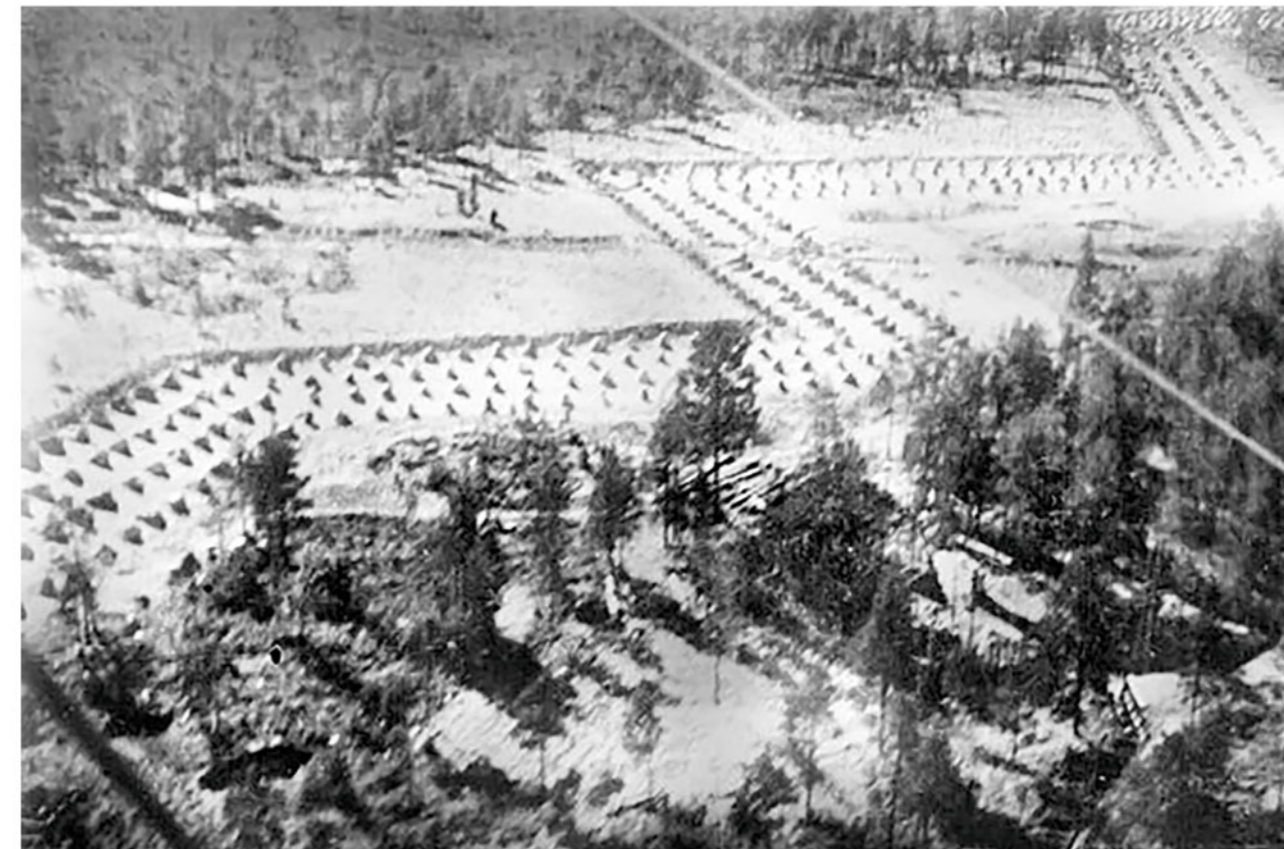
► Вид на линию Маннергейма с высоты птичьего полета.

Не пройдет и месяца, как 26 октября 1943 года Указом Президиума Верховного Совета СССР за образцовое выполнение боевых заданий командования на фронте борьбы с немецко-фашистскими