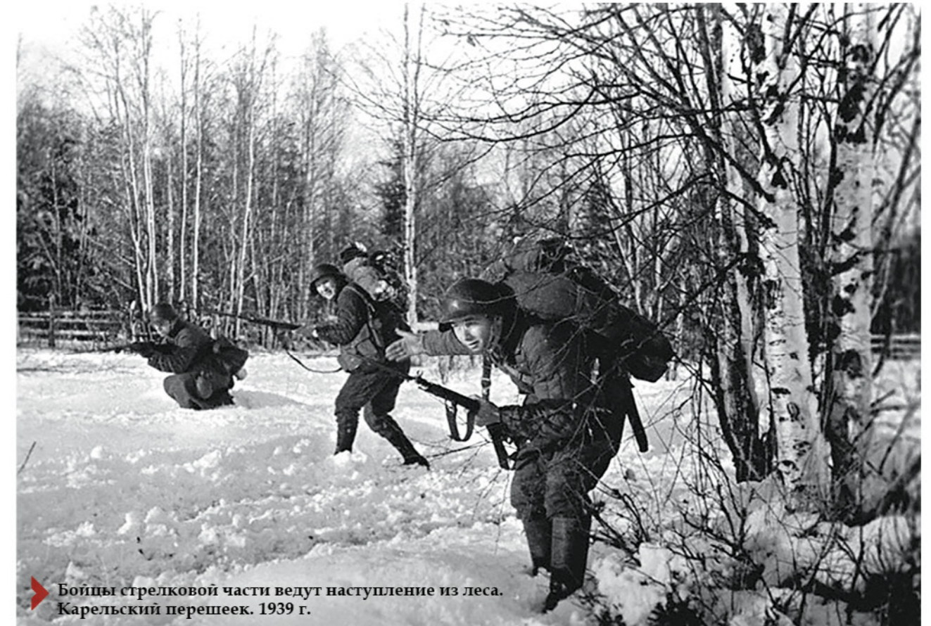
▶ Бойцы стрелковой части ведут наступление из леса. Карельский перешеек. 1939 г.

будет найти свидетельства того, что советские воины не ожидали встретить хорошо укрепленную линию обороны, что вызвало огромное количество вопросов к разведке РККА.