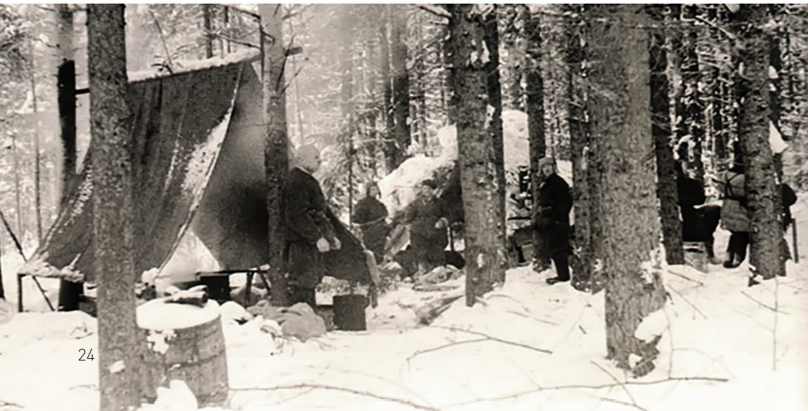
На этой чудом сохранившейся фотографии запечатлены будни отряда.

Глухими тропинками проводили партизаны в тыл противника отдельные диверсионные и разведывательные группы Красной армии. В результате своевременно переданных ими донесений о скоплении немецких войск в районе Буриново советские части успешно выполнили поставленную командованием задачу. Партизаны установили огневые точки артиллерийских и зенитных батарей немецкого полка, расположенного между Буриновом и Барсуками, провели вместе с бойцами 586-го стрелкового полка разведку в деревнях Семкино, Макарово и разбросали у переднего края обороны на участке Буриново-Рыжиково листовки, обращение к немецким солдатам.