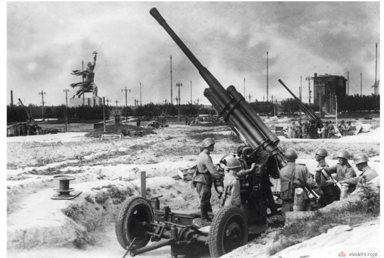
Зенитная батарея на территории Всесоюзной сельскохозяйственной выставки. 1941 год.

Серпухова. Чтобы сдерживать сопротивление, войскам 49-й армии пришлось растянуть линию обороны. В результате уже к концу октября наступление немцев удалось остановить по линии Турчиново-Волоколамск-Дорохово-Наро-Фоминск. Однако Серпухов, в окрестностях которого базировался штаб армии, продолжал находиться под ударом. Поэтому в середине ноября с целью отражения наступления на город мощный контрудар по врагу нанесли созданная Ставкой Верховного Главнокомандования опера-