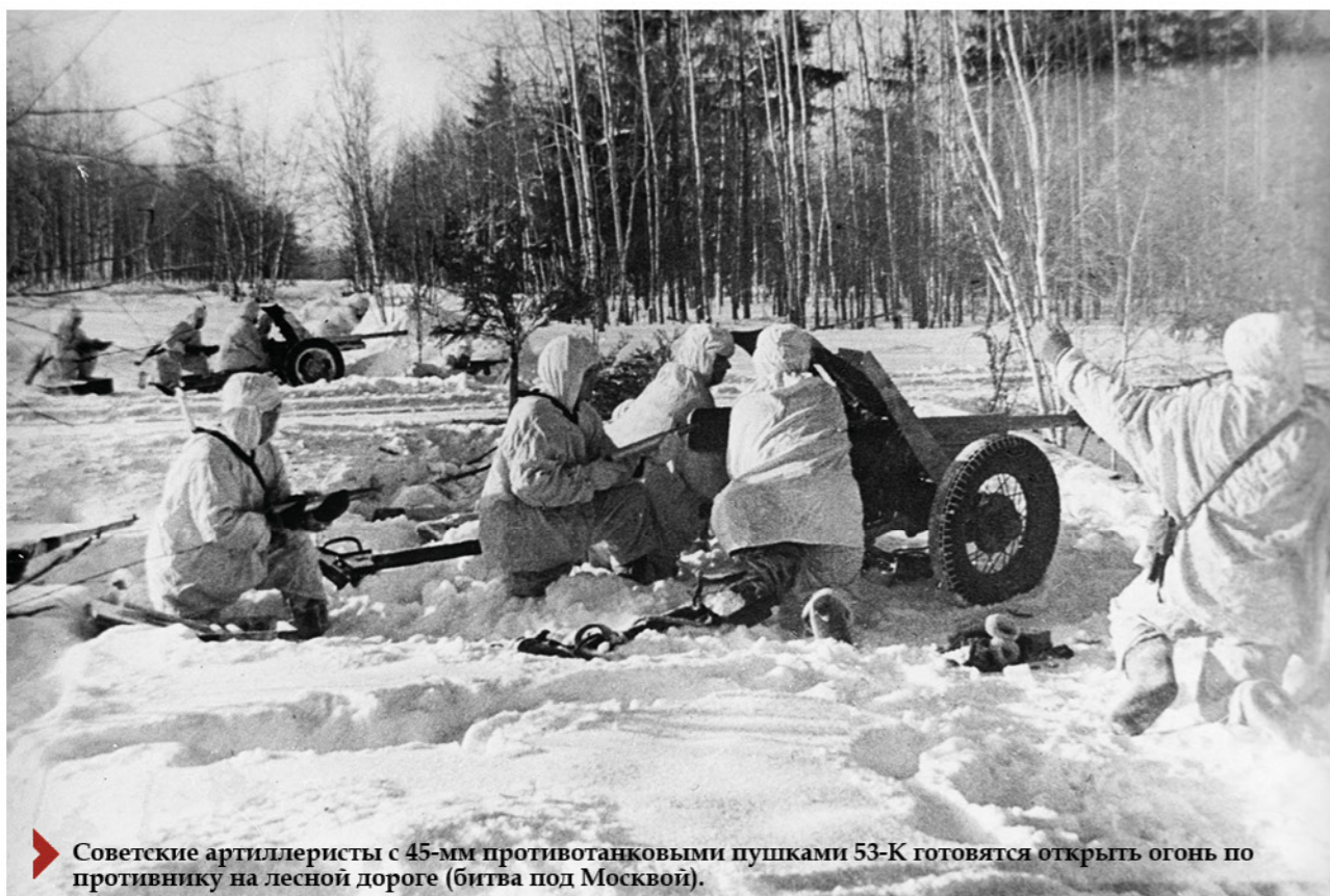
► Советские артиллеристы с 45-мм противотанковыми пушками 53-К готовятся открыть огонь по противнику на лесной дороге (битва под Москвой).

Из письма немецкого солдата Фольтгеймера своей супруге.