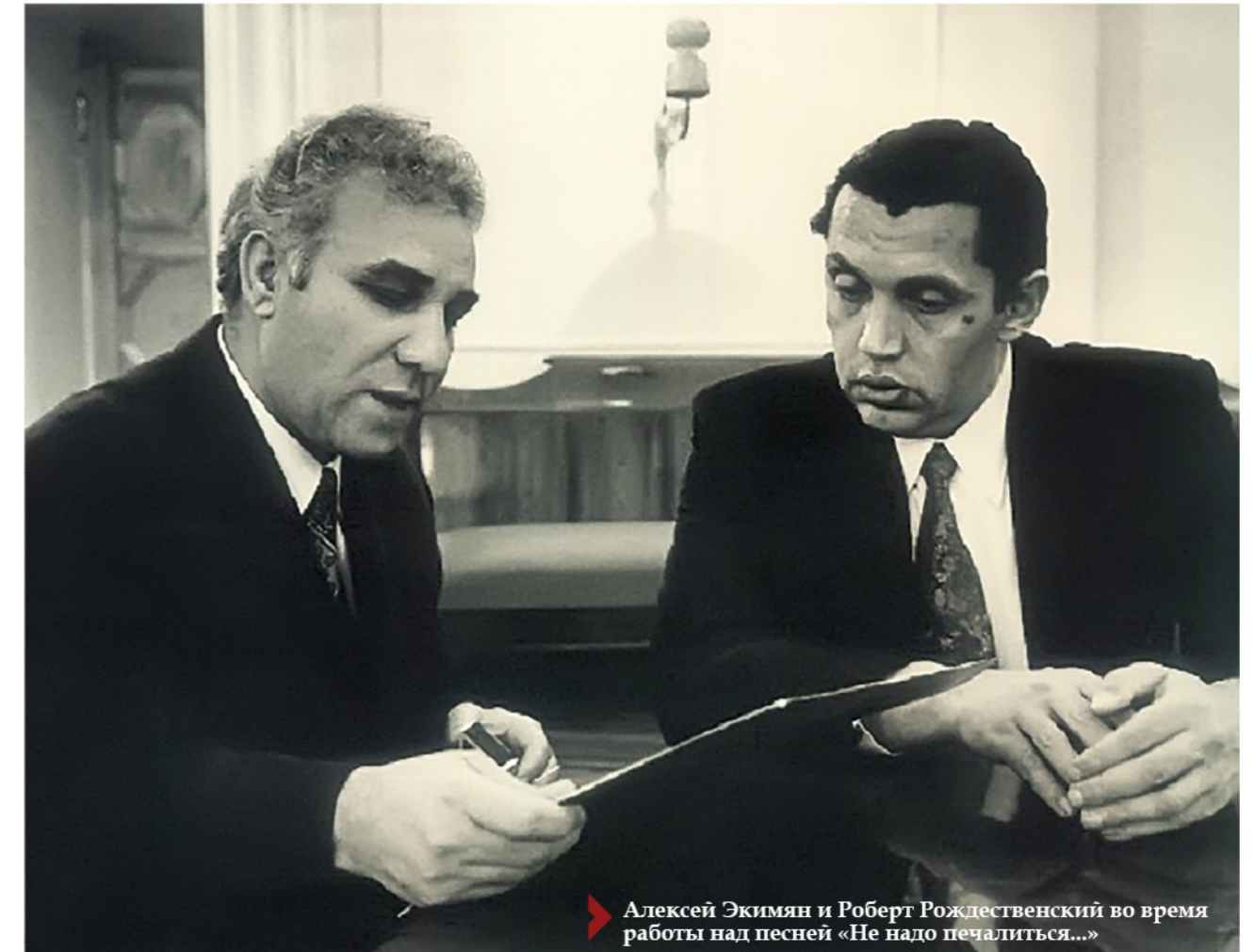
▶ Алексей Экимян и Роберт Рождественский во время работы над песней «Не надо печалиться...»